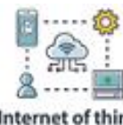
Internet of things